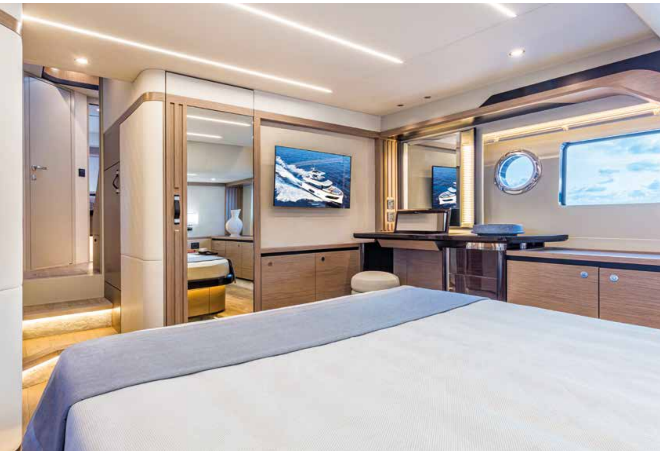
Funzionale ed estetica, la porta a specchio dell'armadio aumenta il senso dello spazio. The wardrobe mirror door enhances the sense of space in a functional and aesthetic way.