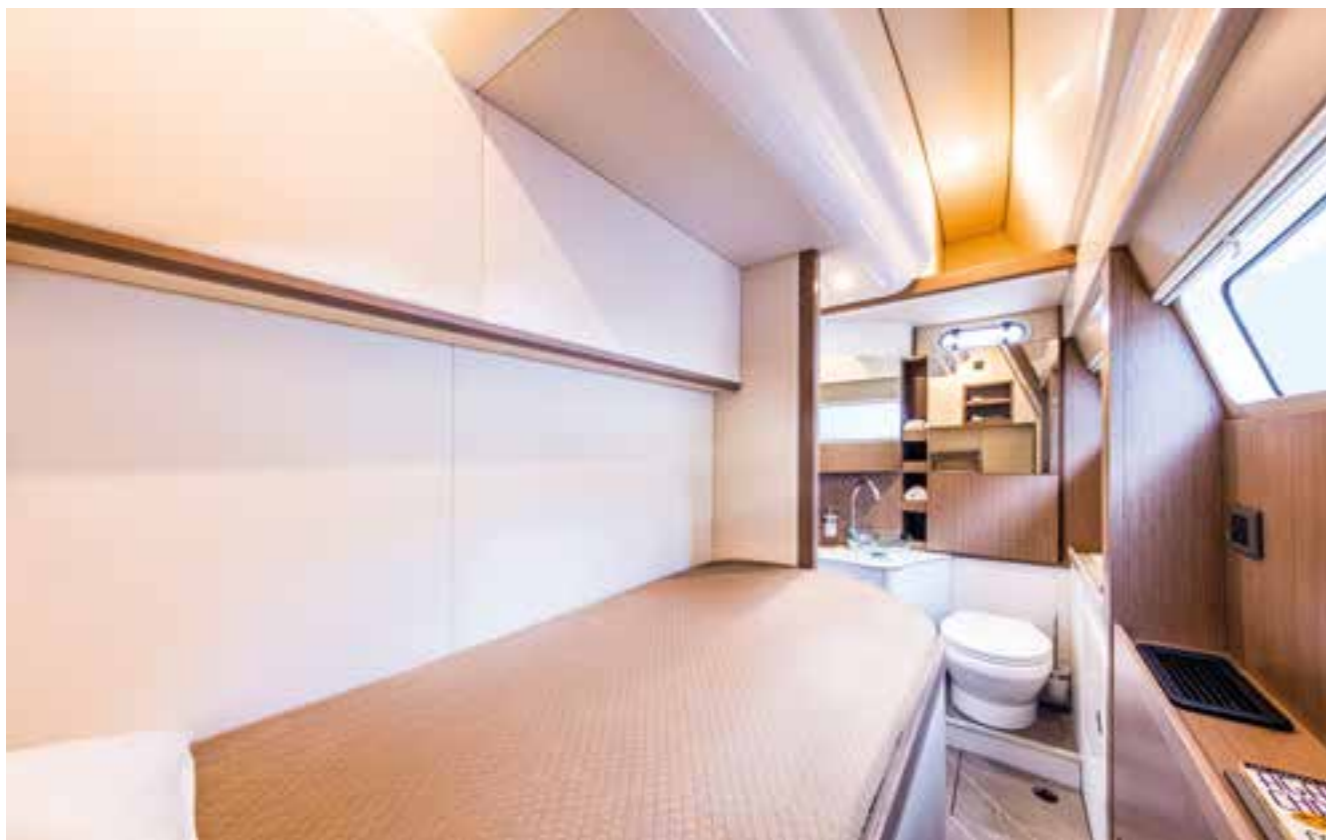
Cabina equipaggio. Crew quarter .