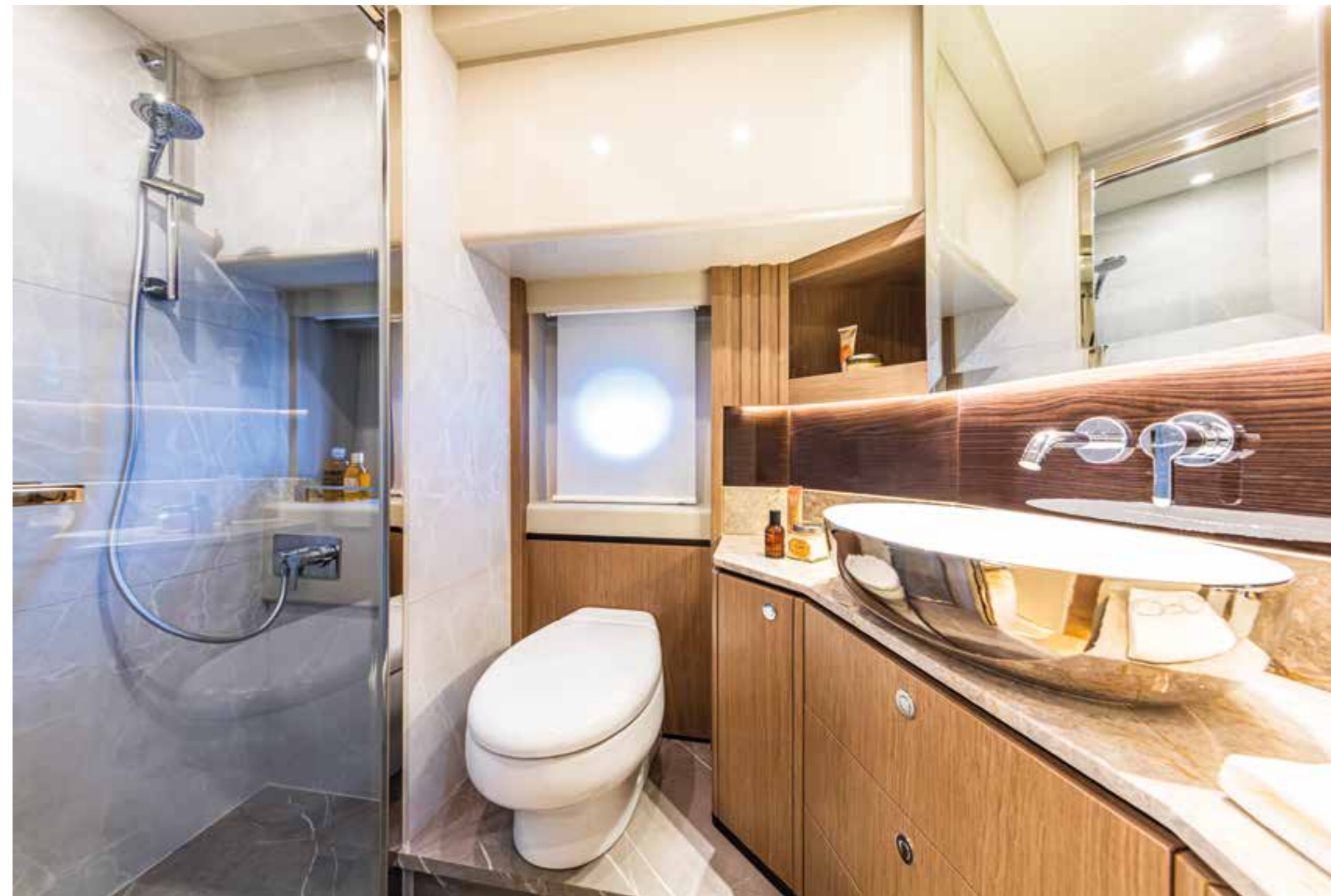
Bagno privato e box doccia con oblò apribile. En suite bathroom with shower and openable porthole.