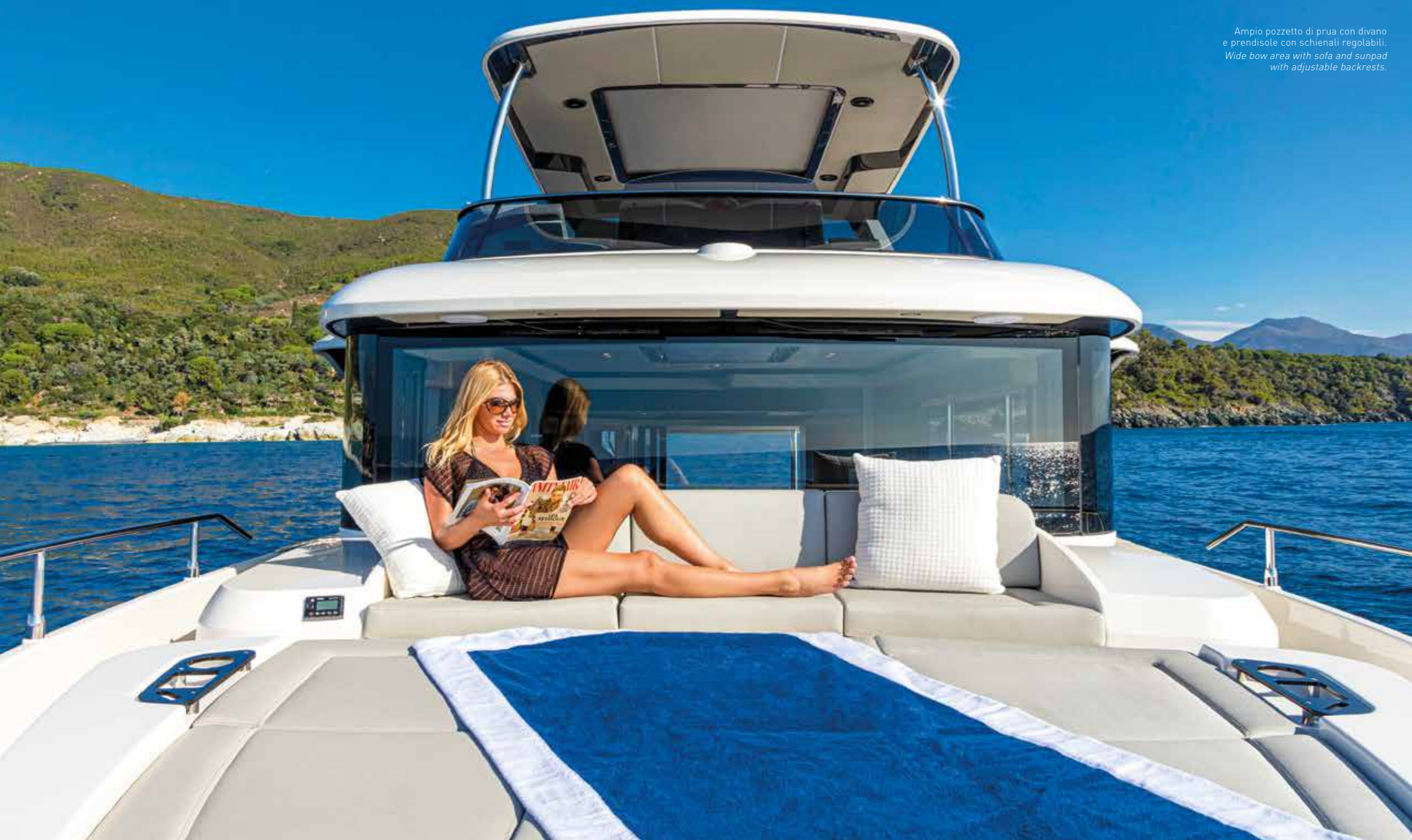
Ampio pozzetto di prua con divano e prendisole con schienali regolabili. Wide bow area with sofa and sunpad with adjustable backrests.